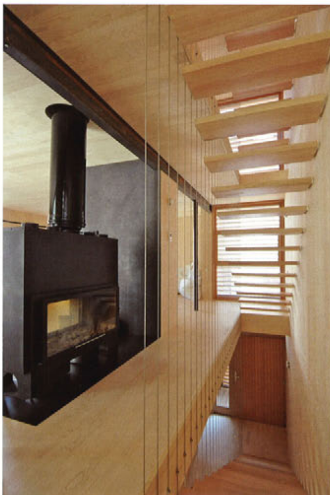
▲ L'ouverture du séjour crée une transparence visuelle sur l'escalier à claire-voie qui met en communication les différents niveaux.

Outre ses avantages en terme d'éco-construction, le procédé assure un chantier rapide et bien adapté au contexte contraint et exigu de l'opération. Des panneaux en bois massifs contre-