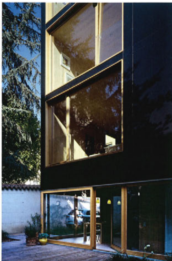
▲ Contraste du bois clair en intérieur et des panneaux bakélinés noirs de la vêtue.