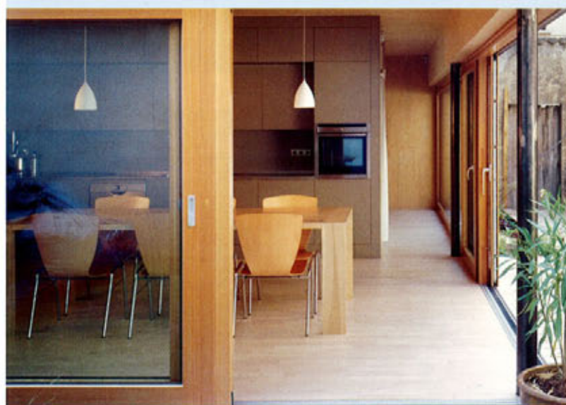
▲ Un rez-de-chaussée largement ouvert sur l'extérieur.

collés à plis croisés forment murs, planchers, et refends. L'isolation thermique des façades et de la toiture par l'extérieur est assurée par 160 mm de fibre de bois. La vêtture extérieure est constituée de panneaux bakérisés noirs qui enveloppent tout le volume. Les menuiseries extérieures sont en mélèze et les sols en parquet de frêne. L'extérieur de la maison est noir, l'intérieur est blanc. Cette formulation architecturale constitue une figure archétypale de la maison, protectrice dehors et bienveillante dedans. ■