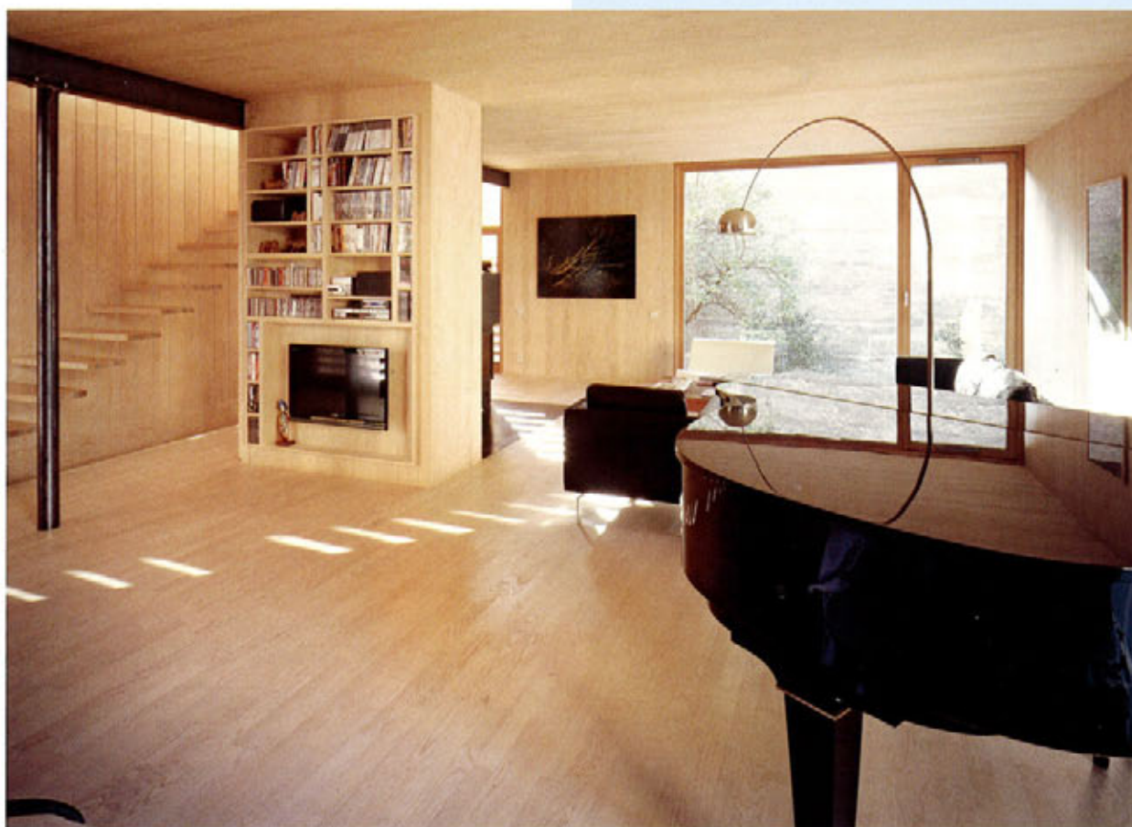
▲ Murs en multiplis d'épicéa et sols en parquet de frêne.